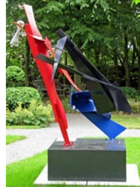
werk van Peter van Tilburg