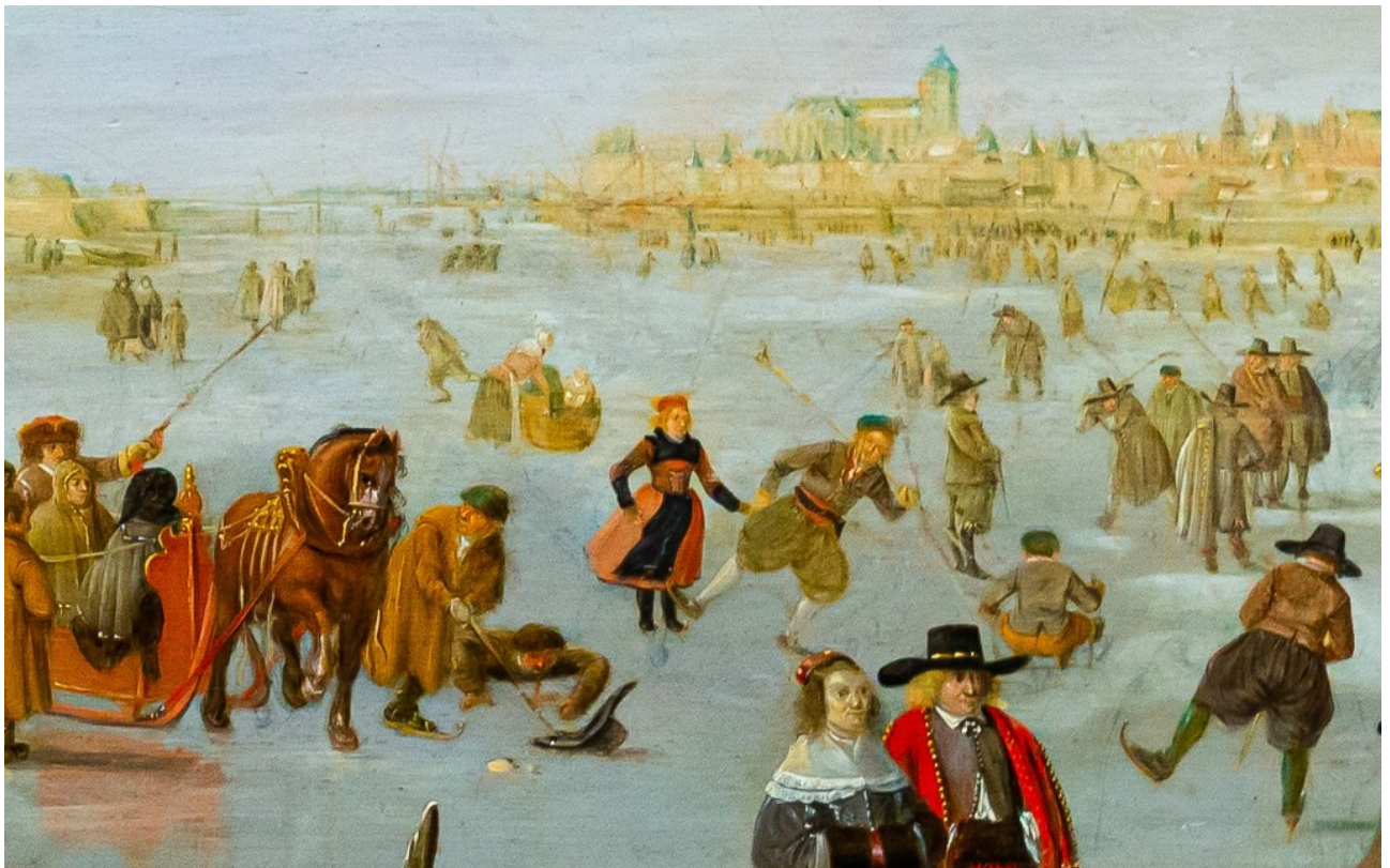
‘IJsvermaak’, Barend Avercamp.