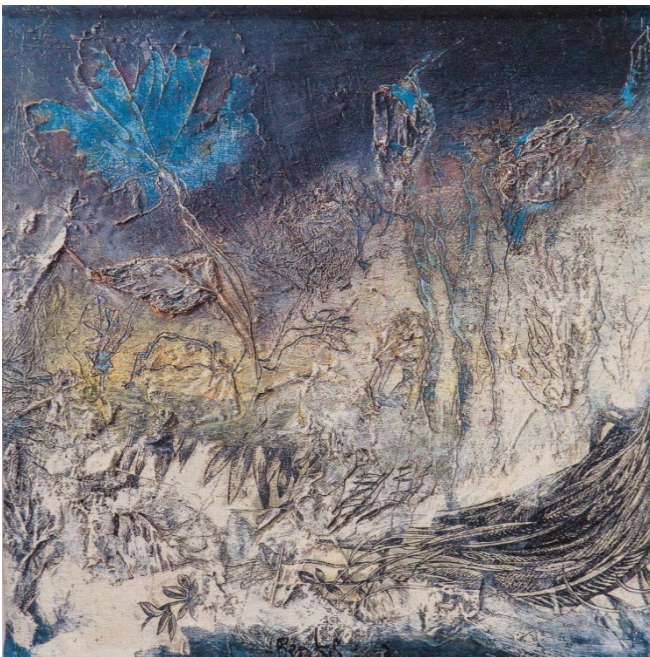
Nacht van Orfeo