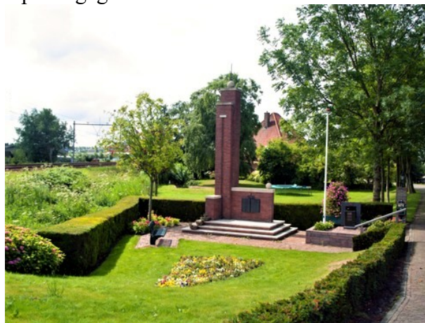
Monument voor de gevallen in Sint Pancras

Mijn vader was als lid van het bevrijdingscomité heel nauw bij de totstandkoming van het monument betrokken. Ik was zelf aanwezig bij de onthulling op 15 april 1946, een jaar nadat daar 20 mannen waren geëxecuteerd.