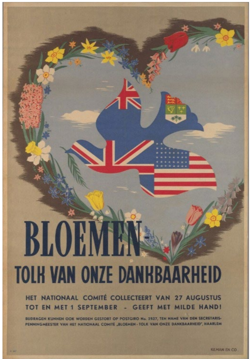
inventarisnummer 159

ondersteuning bij de wederopbouw en dankbetuiging. Dit geschenk werd zeer gewaardeerd door de gemeenschap van Coventy. Volgens de burgemeester van Coventry ontvingen zij hierdoor 'beauty for ashes'.