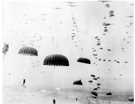
Operatie Market Garden