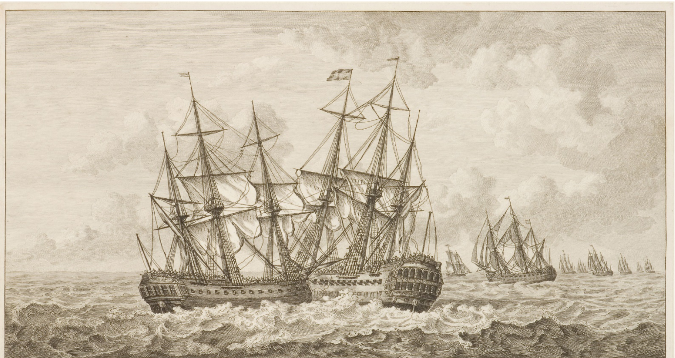
'T AAN-BOORD ZEILEN VAN 'S LANDS SCHEPEN DE PALLAS EN DE VRYHEID. Den 17: DEC: 1788.

slooiknieën. Gewrongen spiegel en holle wulf met twee poorten, hek en zijgalerij van twee verdiepingen, geheel versierd met snijwerk van allegorische figuren, lofwerk en wapentrofeeën. Recht roer voorzien van