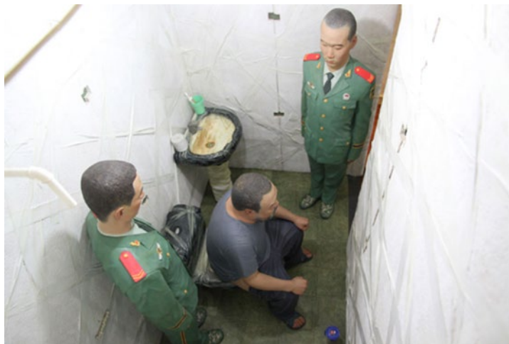
Ai Weiwei, Scène uit S.A.C.R.E.D. (2011-2013).

Wat kan een machthebber doen als de kunst hem niet aanstaat? Hij kan het werk slopen zoals tijdens vele Beeldenstormen is gebeurd; laten censureren, verbranden, wat de nazi's deden met 'entartete kunst'; de kunstenaar vermoorden of – iets minder definitief – gevangenzetten. Dat laatste lot viel bijvoorbeeld de internationaal beroemde Chinese kunstenaar Ai Weiwei ten deel. De Chinese top kon niet overweg met de kritiek die Ai Weiwei met zijn werk leverde op allerlei misstanden in China. Ze besloten de kunstenaar daarom maar op te sluiten in verband met vermeende belastingontduiking: Hij stond 24 uur per dag onder de strengst denkbare controle. Zelfs als hij naar de wc moest en bij het douchen hielden twee bewakers hem in de gaten. Voor Ai Weiwei was dat de reden om S.A.C.R.E.D. te maken, een installatie van scènes uit zijn streng bewaakte opsluiting.