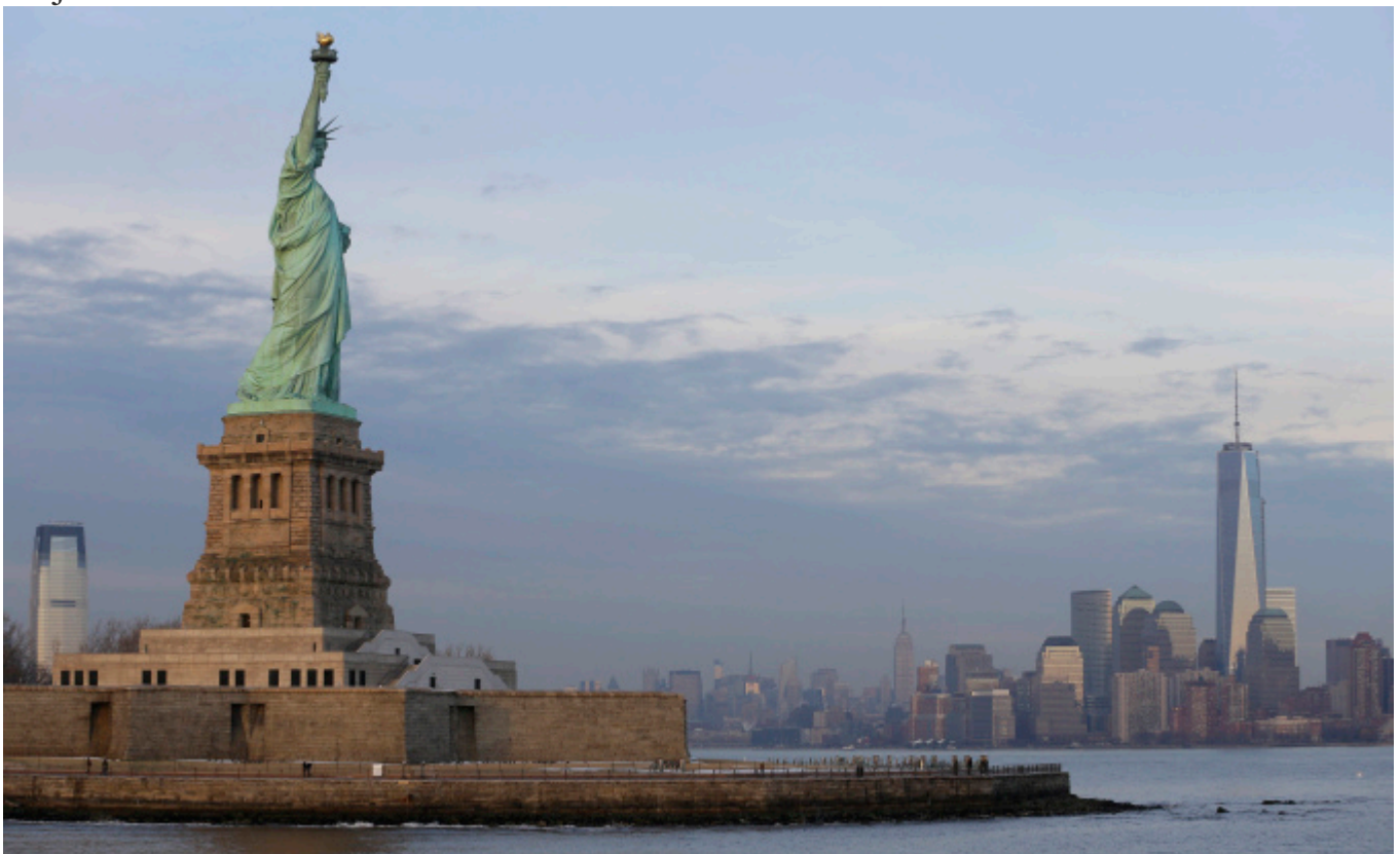
Statue of Liberty, naar een ontwerp van Frédéric Bartholdi (1870).

Op 5 mei is het bevrijdingsdag. Dit jaar een extra bijzondere dag, omdat we 75 jaar vrijheid gedenken. We kunnen het begrip vrijheid op verschillende manieren benaderen. Voor in ons kloosterkwartier is het voor de hand liggend dat we het begrip vrijheid vooral vanuit de kunst benaderen. In de vorige extra uitgave, heeft u kunnen lezen dat vrijheid in de kunst ten tijde van de Tweede Wereldoorlog niet echt een feit was. Maar uiteraard treft u in deze uitgave ook de ervaringen van enkele van ons die de bevrijding en