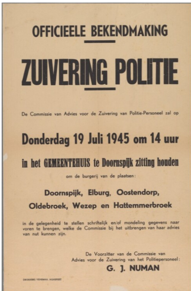
inventarisnummer 158

Vanaf 27 augustus tot 1 september 1945 organiseerde het Nationaal Comité een collecte. Van de opbrengst werden bloembollen en planten gekocht die werden geschonken aan zwaar getroffen geallieerde steden. Een voorbeeld hiervan is het Engelse Coventry dat in 1940 gebombardeerd werd door de Duitse Luftwaffe. In 1947 ontvingen zij vanuit Nederland bloembollen en planten als symbolische