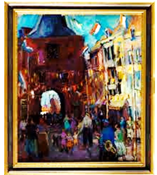
Feest bij de Vischpoort Olieverfschilderij op doek, waar een feest aan de gang is.

Er hangen vlaggen uit, er lopen mensen op straat; op de voorgrond loopt een man met een trompet. Voorstellende gezicht op de Vischpoort te Elburg, vervaardigd door J. Lussenburg, 20e eeuw. Dit schilderij is in het bezit van Museum Elburg en hangt in de Elburgzaal.