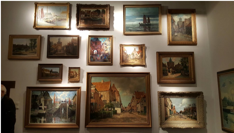
1Elburgzaal, Museum Elburg