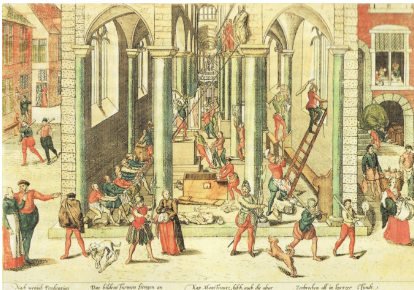
Vernieling van de Onze-Lieve-Vrouwenkathedraal te Antwerpen op 20 augustus 1566. Gravure gemaakt door Frans Hogenberg.

Het beeld vormt bovendien ook een herinnering aan de Onafhankelijkheidsverklaring en verwijst naar de strijd die de Amerikanen voor hun vrijheid hebben moeten voeren, ten koste van vele levens. Vrijheid is dus niet zomaar iets. Bovendien heeft vrijheid ook zijn grenzen en beperkingen, grenzen die men zelf stelt als individu aan de vrijheid van een ander en andersom. Die ander kan iemand in de directe omgeving van familie, vrienden en buurt zijn, maar kan ook godsdienst of de overheid betreffen. Beperkingen door godsdienst en de overheid zijn de meest opvallende belangen waarmee drang naar vrijheid in botsing komt. Voorafgaand aan onze Gouden Eeuw kwam dat in 1566 bijvoorbeeld tot uiting in de Beeldenstormen die over de Nederlanden raasden. Daarbij sloopten protestanten kunst uit rooms katholieke kerken als blijk van afkeer van de paapse poppenkast en afgoderij; die kunst voldeed niet aan hun nieuwe, strengere normen. Ook aan Elburg gingen deze Beeldenstormen niet voorbij. Uit Museum