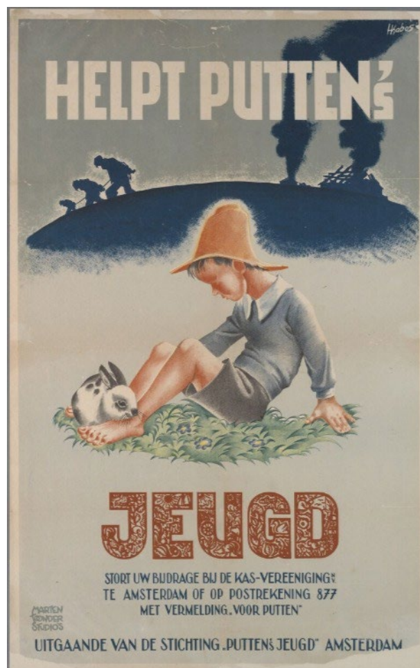
Collectie J.L. De Boer, inventarisnummer 162

In 1945 werd de Stichting ”Putten's Jeugd” opgericht. Deze Stichting gaf financiële bijstand aan de families van de Puttense mannen die tijdens de Puttense razzia werden weggevoerd en nooit meer terugkwamen. De razzia van Putten had in heel Nederland een diepe indruk achtergelaten; en dit was ook zeer zeker het geval in de nabijgelegen gemeenten op de Veluwe. Vanuit heel Nederland en daarbuiten werden gelden en middelen gedoneerd. In 1964 werd deze Stichting opgeheven. Het restant van het geld is toen overgedragen aan de gemeente Putten, waarna het werd verdeeld over bibliotheken en scholen in Putten.