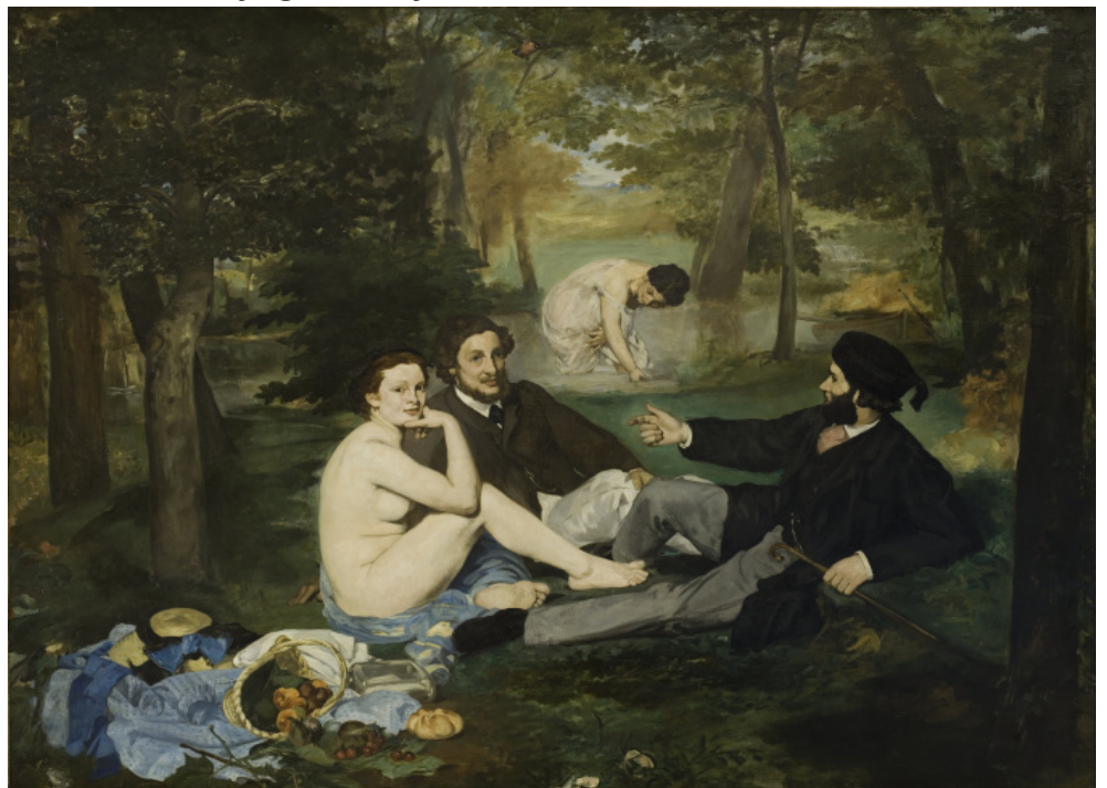
Eduard Manet, Déjeuner sur l'herbe (1863).