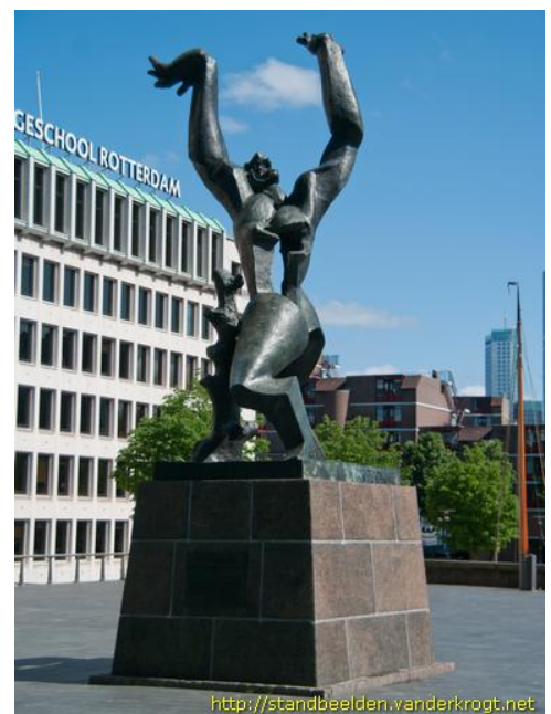
Het kunstwerk De verwoeste Stad van Ossip Zadkine

Note: In de loop der jaren heeft het beeld van de Rotterdammers een rits van bijnamen gekregen. Naast "De verwoeste stad" kent men het beeld als "Stad zonder Hart", "Zadkini", "Jan Gat", "Jan met de Handjes" en "Jan met de Jatjes".