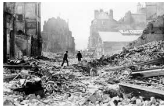
Bombardement op Rotterdam, 14 mei 1940

M'n opa werd het al snel teveel daar en weet een huis te kopen in het dan nog rustige Oosterbeek. Gelegen aan het "Stenen Kruis"; de uiterste rand van het dorp en mooi uitzicht op Arnhem en station O-laag. Een ideale plek om te logeren, wat ik samen met moeder vaak deed. Opa pachtte ook wat land ertegenover om zelf aardappels te verbouwen en bonen. Vooral dat laatste was leuk werk om te helpen: hij liet telkens 3 bonen in een kuiltje vallen en ik kon die met kleine vingertjes goed weer achter zijn rug oprapen!!