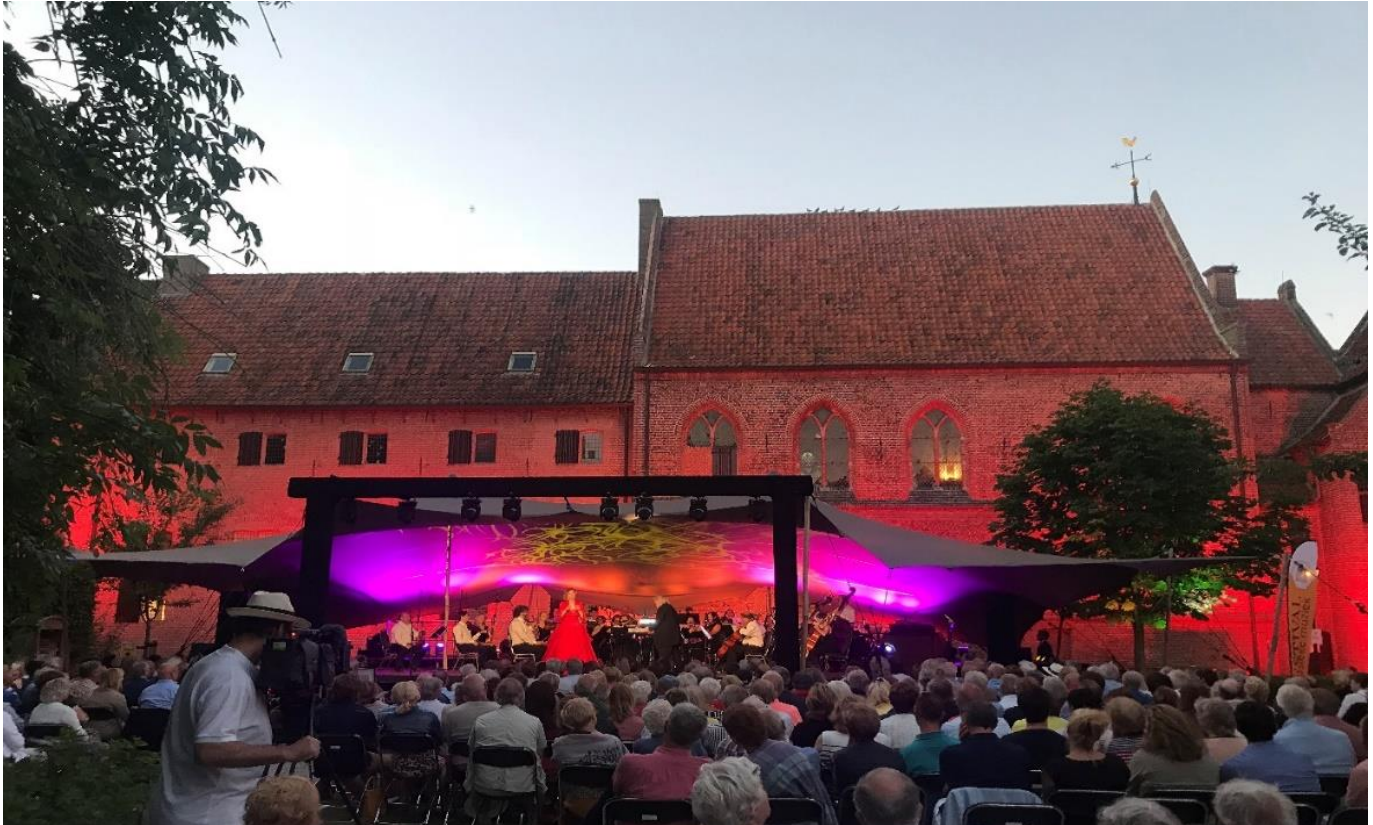
Dit was 2019, en zo mag het weer worden in 2023

Mede dankzij onze eigen mensen in Museum Elburg en de VVV, de stadsgidsen, Gemeente Elburg (Verkeerslogistiek), Het Geldersch Landschap, de A.Vogel Tuinen, de horecaondernemers, de Sint Nicolaaskerk en de Festivalorganisatie kunnen we met vertrouwen vooruitkijken naar volgend jaar: op