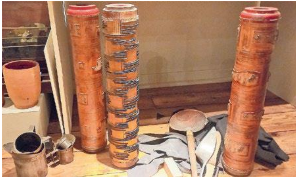
Stempels om behang te decoreren

Het Schildersmuseum wordt 31 maart aanstaande geopend. Het is werkelijk prachtig geworden. U kunt gewoon met uw toegangsbewijs voor Museum Elburg dit inspannende nieuwe museum vanaf 31 maart bezoeken. De oprichting van dit museum was een initiatief van oud-schilder en mbo-docent Anton van Wezep. Na een publicatie in samenwerking met de Oudheidkundige Vereniging Arent thoe Boecop, ging het kriebelen om meer te realiseren. Dus rezen er plannen voor een Schildersmuseum. Na regelmatig overleg met bestuur