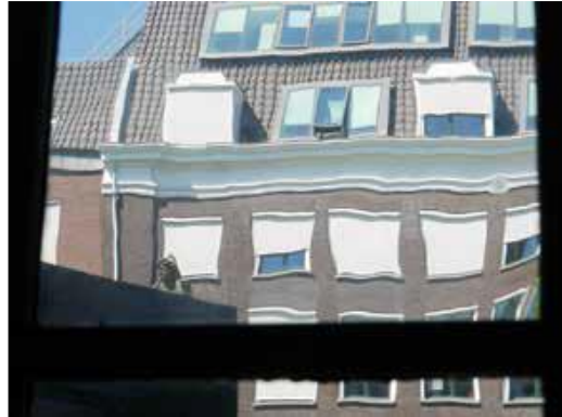
Ronde vervorming en een ronde luchtbel in kroonglas, Huis van Brienen, Amsterdam