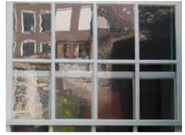
Vervormingen in verschillende soorten vensterglas, Huis van Brienen, Amsterdam

‘Vensterglas’ werd geslingerd, geblazen en later ook getrokken uit vloeibaar glas. Dit glas bevat veel oneffenheden, die verraden welke techniek gebruikt is en daarmee vaak ook hoe oud de ruiten zijn. Luchtbelletjes in een ruit wijzen er doorgaans op dat de ruit geblazen is. Het vroegste vensterglas werd gemaakt door een klomp gesmolten glas aan een stang te slingeren tot een schijf. Hieruit werden ruitvormige stukjes glas gesneden, want dat was de meest efficiënte vorm; daarom hebben we het nu nog over glazen ‘ruitjes’ in vensters. De schijf was klein en ongelijk in dikte.