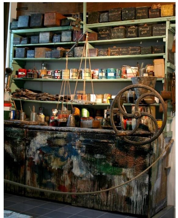
Potmolen met draaiwiel in de schilderswinkel van Deetman

Daarnaast kunt u kennis nemen van de geschiedenis van de Gilde en de ontwikkeling van het beroepsonderwijs toegespitst op de opleidingen voor schilders. Er is op de zaal in foto's en teksten veel specifieke aandacht voor de schilders uit Elburg.