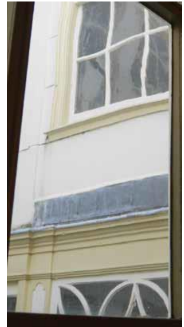
Langwerpige, golvende vervorming en ovale luchtbel in cilinderglas, Huis van Brienen, Amsterdam

In de middeleeuwen bedacht men de volgende twee methodes om het vensterglas groter en egaler te krijgen. Door het vloeibare glas tot bol te blazen, deze af te platten en vervolgens uit te slingeren, werd de schijf wat egaler van dikte en groter. Het midden was dik en de randen waren dun. Dit zogeheten ‘kroonglas’ was dus rond en bleef in het midden wat dikker dan aan de randen. In het begin waren de ruitjes, die uit dit glas gesneden werden, erg klein en werden ze met lood aan elkaar gemaakt tot een groter oppervlak. Door de eeuwen heen werden de ruitjes groter (tot de schijven een diameter van 125 cm konden bereiken) en was glas in lood niet noodzakelijk meer, anders dan voor decoratieve doeleinden. Dit tot schijf geslingerde ‘kroonglas’ is te herkennen aan gebogen ribbels en verdikkingen in het glas en de ronde luchtbelletjes. In het Buitenmuseum in Enkhuizen is dit glas bijvoorbeeld nog terug te vinden in woningblok Siberië, MK2. Daarnaast was er een van oorsprong middeleeuwse techniek om rechthoekige glazen platen te krijgen. Er werden glazen cilinders geblazen, die in koude, harde toestand over de lengte werden doorgesneden en vervolgens plat werden gemaakt in de oven. Hiermee konden al snel grotere glasruitjes worden gemaakt, die weliswaar iets egaler waren van dikte, maar die nog steeds ribbels en langwerpige, golvende vervorming en ovale luchtbel in cilinderglas vertonen.