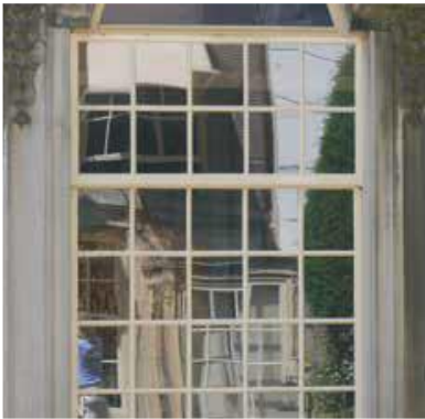
De vervorming valt mee maar de totale reflectie is ‘gebroken’, spiegelglas in Huis van Brienen, Amsterdam